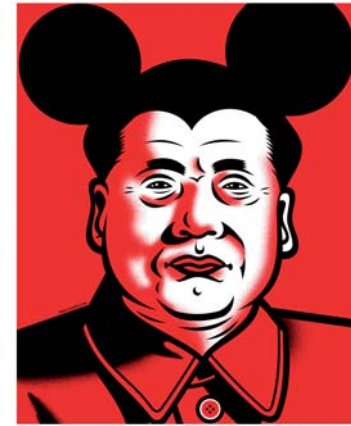
1 2 China Capitalista. Ilustración de revista. México, 2005.